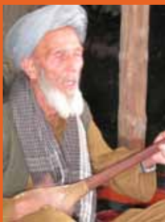
ر جب محمد جر می