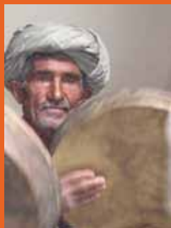
تازه گل وخی