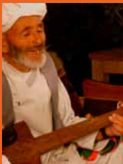
شاه نصیر اشکاشمی