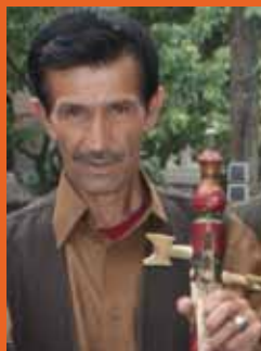
رحمت جر می