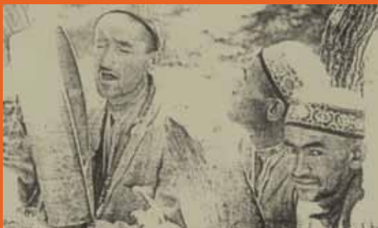
محمد اکبر، مغل بیگ و آدینه هنرمندان و احان